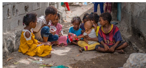
Dans un quartier d'Aden, 2022

https://www.letemps.ch/monde/moyenorient/yemen-millions-denfants-menaces-malnutrition