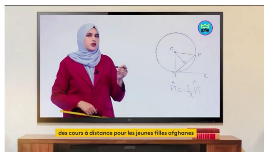
Cours à distance pour les filles afghanes

https://www.nouvelobs.com/monde/20240320.OBS85977/en-afghanistan-troisieme-rentree-scolaire-sans-les-filles.html