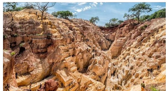
News.abangui.com – Mines illégales en Centrafrique

https://www.rfi.fr/fr/podcasts/afrique-%C3%A9conomie/20240317-centrafrique-travail-enfants-mines-subsiste